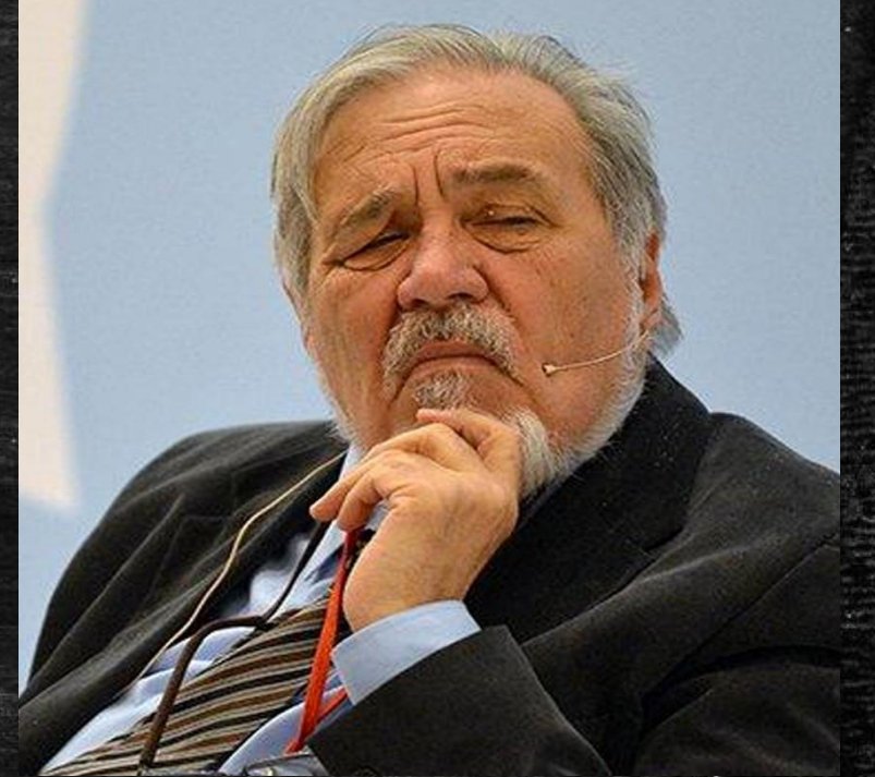
İLBER ORTAYLI, Türk tarihçi , akademisyen, yazar.