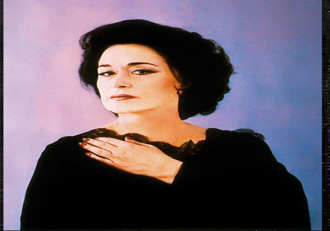
Ayşe Leyla Gencer , Türk opera sanatçısı. 20. yüzyılın en önemli sopranolarından biri olarak görülür.